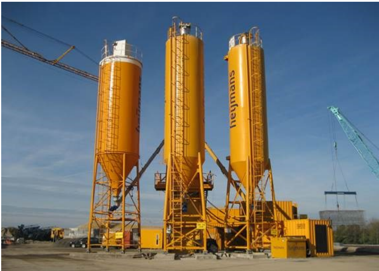
Afbeelding: het betonplein bestaat uit 3 betonsilo's zoals u ze ook op deze afbeelding ziet.

De menginstallatie is de plek waar het cement, zand, grind en water in een mengunit gestort worden om daarna te mengen tot beton. De menginstallatie wordt bekleed met geluidschermen. Dit zorgt voor meer dan een halvering van het geluid. De stortkoker, waardoor het beton in de betonmixers gestort wordt, krijgt een geluidswerende flap. Ook deze zorgt voor meer dan een halvering van het geluid.